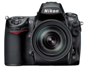
Japon: Premiers appareils à photos numériques