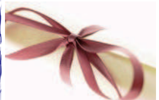
Vierzon: Z3T est labellisé Centre Régional d'Innovation et de Transfert de Technologies (CRITT)