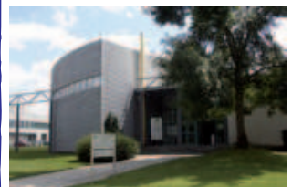
Issoudun: Création du 1 er département d'IUT (TC)