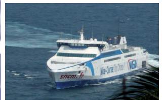
France: Le NVG Liamone (Navire à Grande vitesse)