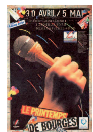
Printemps de Bourges: 16 e édition du festival